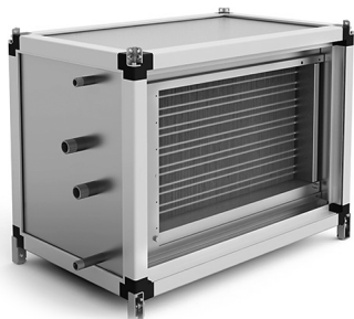
Водяной нагреватель SPH-W