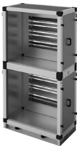
Секция перекрывающая (с 2 заслонками)

Секции предназначены для разделения и перекрытия воздушных каналов основного и резервного вентилятора. Секция S3 предназначена для установки на стороне входа вентиляторов. Секция S4 предна-