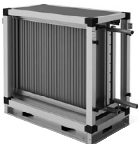
Секция водяного охлаждения

Секции представлены 8 типоразмерами, в каждом из которых доступны два исполнения: трёхрядное и четырёхрядное. Поверхность теплообменника изготовлена из алюминиевых пластин и проходящих через них в шахматном порядке медных трубок. Трубные коллекторы из стали имеют резьбовые патрубки для