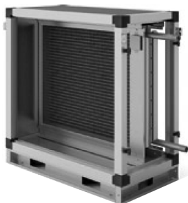
Секция водяного нагрева

Секции водяного нагрева представлены восемью типоразмерами, в каждом из которых возможны два исполнения: двухрядное и трёхрядное. Предназначены для эксплуатации при максимальном рабочем давлении 1,5 МПа и максимальной рабочей температуре воды 170°С. Поверхность теплообмена изго-