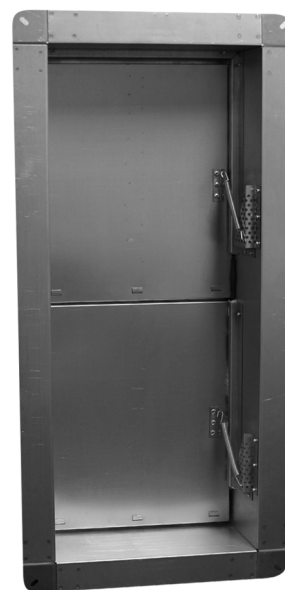
Клапан КИД (90)

Размер проема в ограждающей конструкции тамбур-шлюза определяется проектировщиком в зависимости от производительности и давления вентиляторов дымоудаления и подпора противодымной системы.